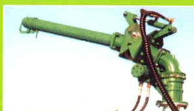
Canon d'épandage avec groupe Garda