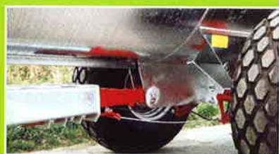
Flèche à ressorts